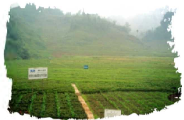
雅安三九优质无公害中药材生产基地

此前，华润三九已建有麦冬、附子、鱼腥草、红花等多个GAP种植基地。加大GAP种植基地建设，旨在“往上游延伸建立药材基地以控制原材料成本，保障药材供应以保障产品质量”。