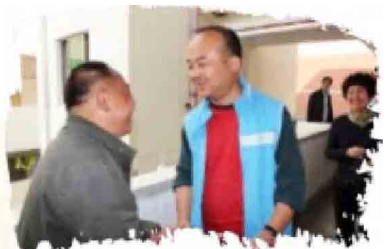
欢乐 祥和 温暖 关怀